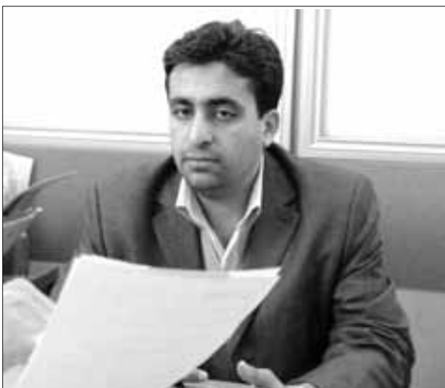
مدیر واحد سیستمها و روشها: